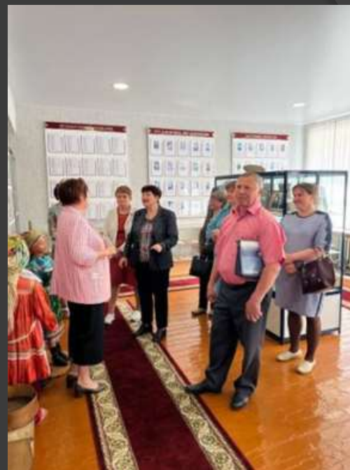
Семинар директоров школ Атюрьевского района.