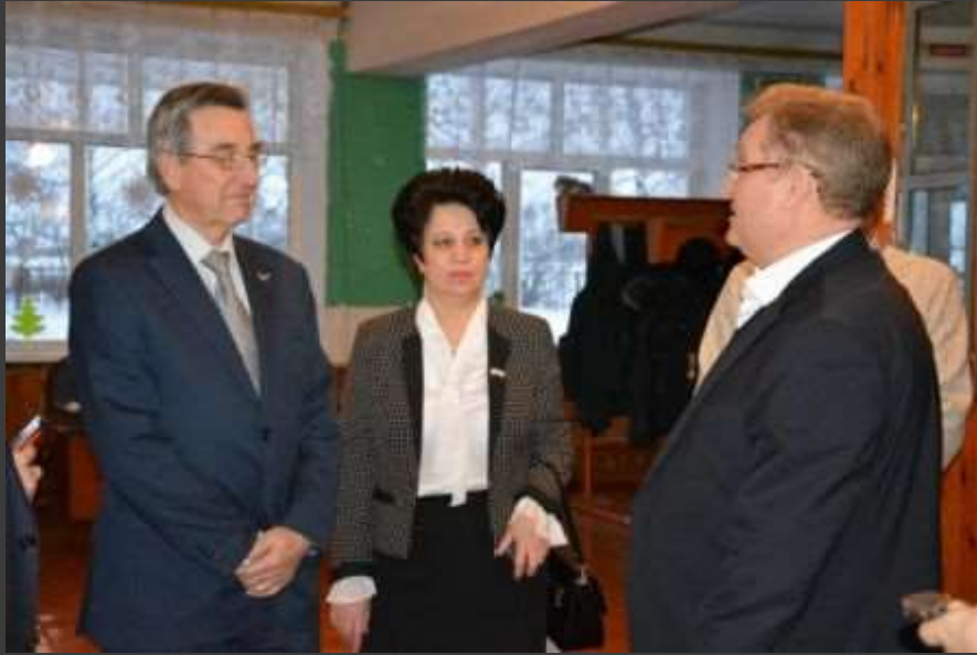
Депутат Государственной Думы Ефимов В.Б.